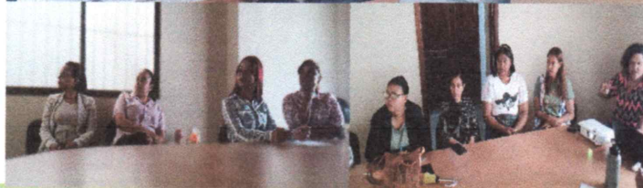
Interacción de los participantes durante desarrollo del taller.